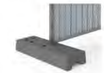
plot béton 36 kg