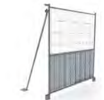
jambe de force à cheviller ou lester