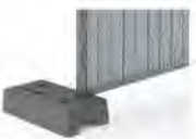
plot béton 26 kg